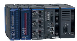
LR8101 / LR8102 LOGGERS MODULAIRES