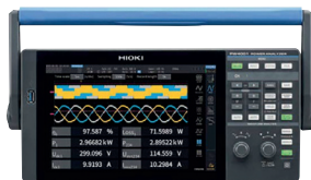
PW4001 POWER ANALYZER