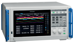
PW8001 POWER ANALYZER