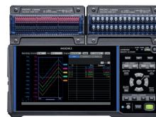
LR8450 MEMORY HILOGGER