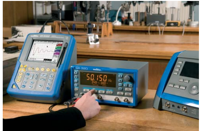
La fonction « save » est très utilisée en optique notamment pour le contrôle qualité des cristaux.

De plus, les GX 310 et GX 320 balayent une large plage de fréquence tout en conservant une phase constante lors des sauts en fréquence.